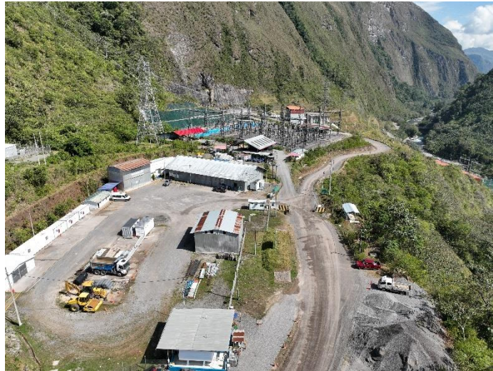
Foto 3.- Áreas sin uso colindantes a SE Eléctrica y casa de máquinas